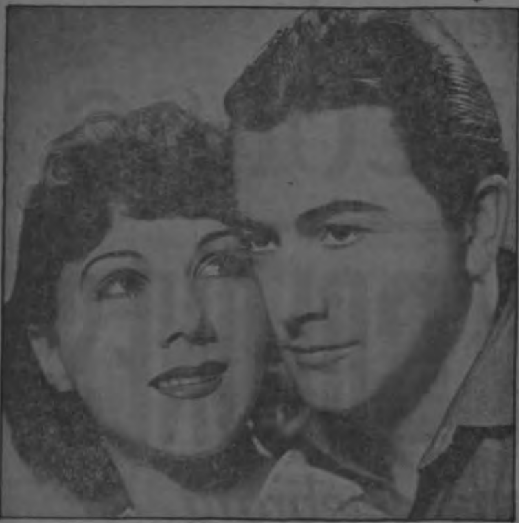
Jean Parker and Robert Young in "Lazy River"

Un bello romance de amor junto a la pereza inmensa de un río blando y calmoso: eso es "Nueva Aurora" que se estrena hoy en el Variedades. Los intérpretes de esta joya son Jean Parker, Robert Young y May Robson.