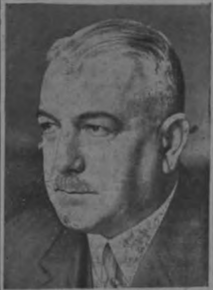
Knostatin Von Neurath Ministro de Relaciones de Alemania